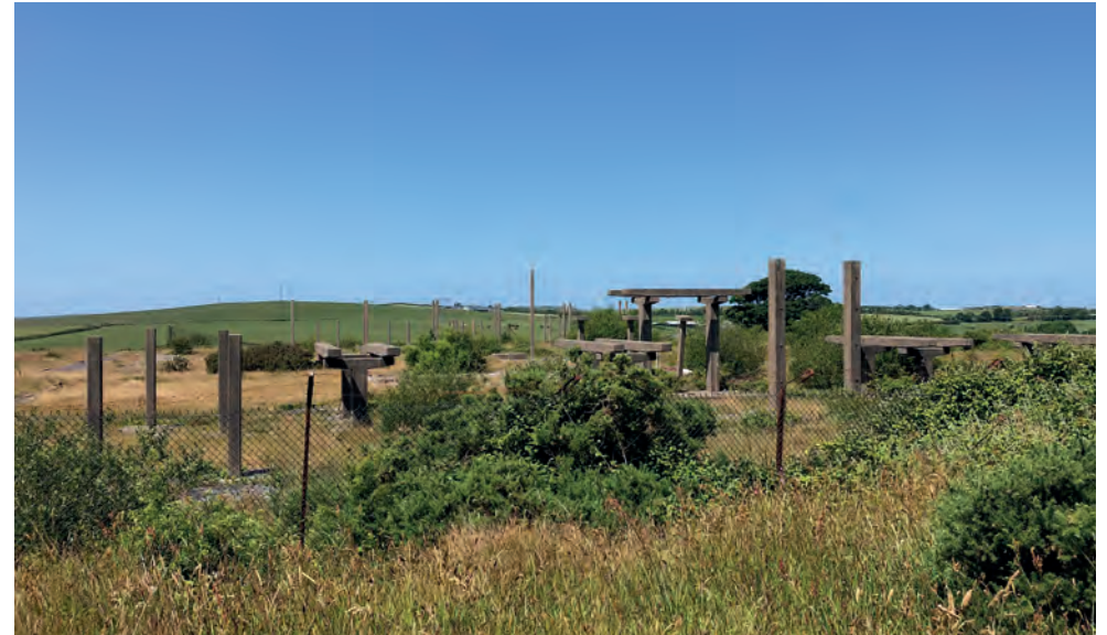
Mae'r Hen Safle Depo Olew yn Rhosgoch yn cael ei archwilio fel lleoliad posibl ar gyfer Prosiect Solar Cymunedol BESS a 5MW

Mae cytundebau ariannol yn gweithredu fel buddsoddiad yn yr economi leol a allai hybu gwariant defnyddwyr a thrwy hynny greu swyddi ysgogedig. Ar ôl cymryd rhagdybiaethau treth i ystyriaeth a chyfran yr incwm a fyddai'n debygol o gael ei wario'n lleol ar sail categorïau nwyddau a gwasanaethau gwariant aelwydydd, amcangyfrifir y gallai rhwng £800,000 a £1 miliwn gael ei wario'n lleol y flwyddyn, gan gefnogi busnesau lleol a, thrwy hynny, swyddi. Drwy ragdybio allbwn fesul gweithiwr ar Ynys Môn, awgrymir y gallai rhwng 35 a 45 o swyddi gros ysgogedig gael eu cefnogi'n lleol yn ystod y cam gweithredol o ganlyniad i'r buddsoddiad hwn yn yr economi leol gan yr Ymgeisydd.