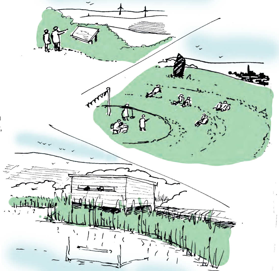
Syniadau i'w harchwilio gyda chymunedau

Mae'r Prosiect yn creu cyfle i reoli'r dirwedd yn gynaliadwy ar raddfa eang ar draws nifer o ddaliadau tir drwy gydol oes y prosiect. Mae hyn yn cyd-fynd â thema Datganiad Ardal Gogledd-orllewin Cymru, Cefnogi Rheoli Tir yn Gynaliadwy.